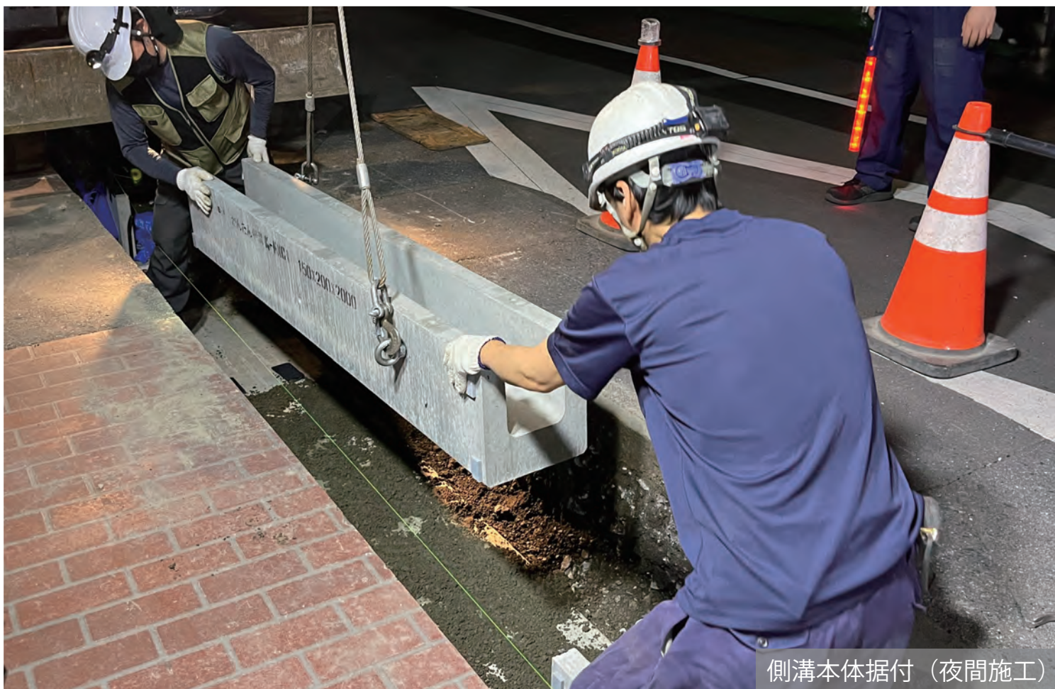
側溝本体据付（夜間施工）

東京都豊島区の巣鴨地蔵通り無電柱化事業において、「安全で快適な歩行空間」と「良好な都市景観」を構築することを目的に、当社製品のランドスケープ側溝ミニ(B150)が採用されました。グレーチングを側溝端部に配置することで、官民境界ギリギリに側溝を配置でき、意匠性にも優れた景観型側溝です。